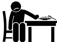
Loss of appetite