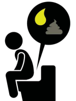
Orina oscura, heces pálidas, y diarrea

Si usted piensa que pudiera estar padeciendo de la Hepatitis A, acuda a su médico o a la sala de urgencias más cercana. Siempre lávese las manos con agua y jabón después de usar el baño o cambiar pañales y antes de entrar en contacto con alimentos.